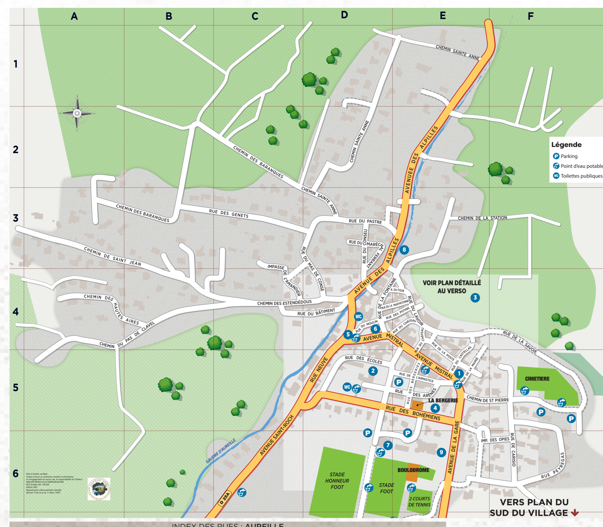
INDEX DES RUES : AUREILLE